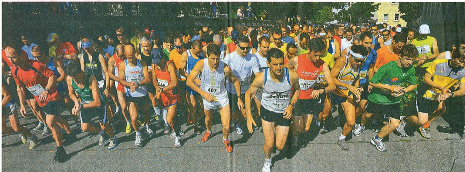
Achtung, fertig, los: Bei guten äusseren, aber windigen Bedingungen wurde der diesjährige Rheinfall-Lauf in Neuhausen gestartet.